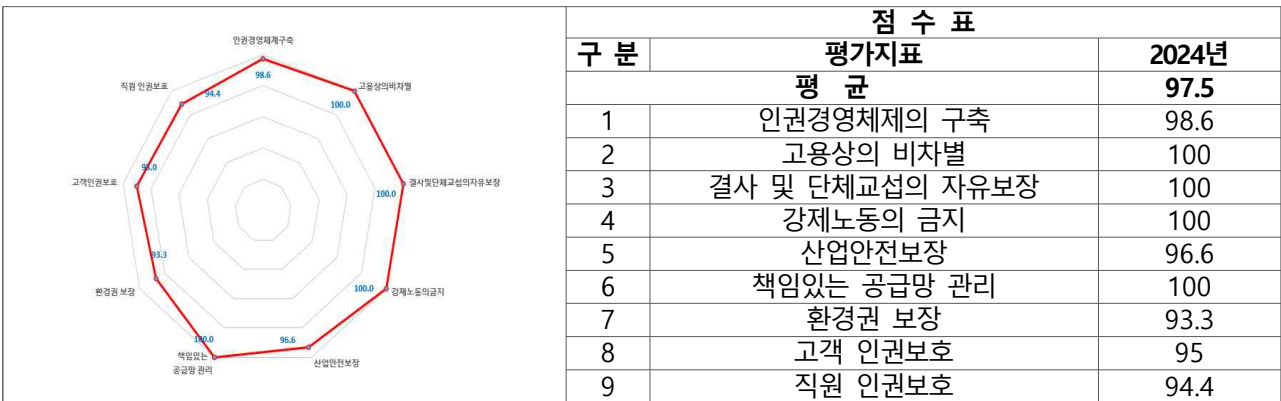
사업운영 인권영향평가(만천하스카이 5개 분야 21개 지표)